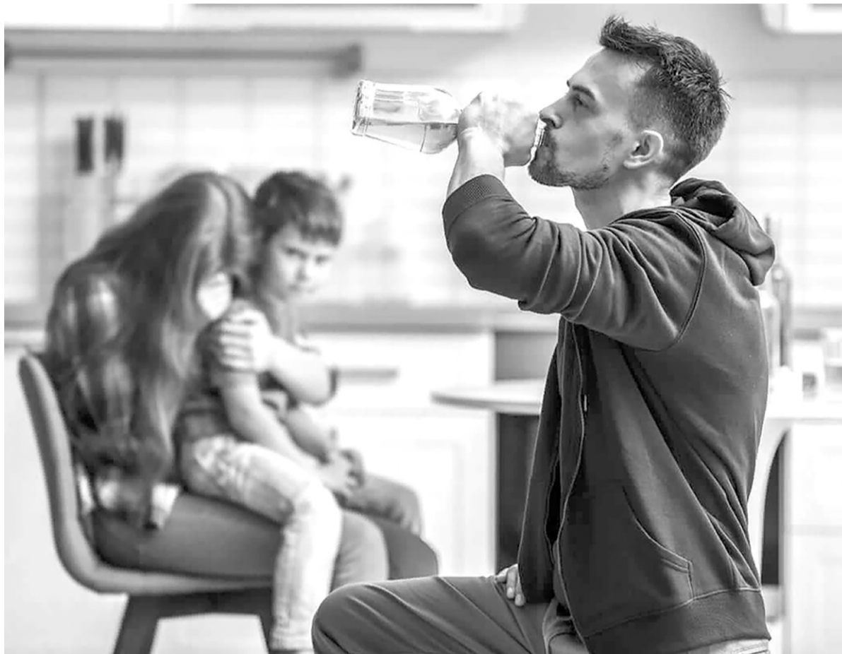
В семьях, где пьют родители, в первую очередь страдают дети

Люди, злоупотребляющие алкоголем, также сталкиваются с заболеваниями желудочно-кишечного тракта, так как слизистая оболочка