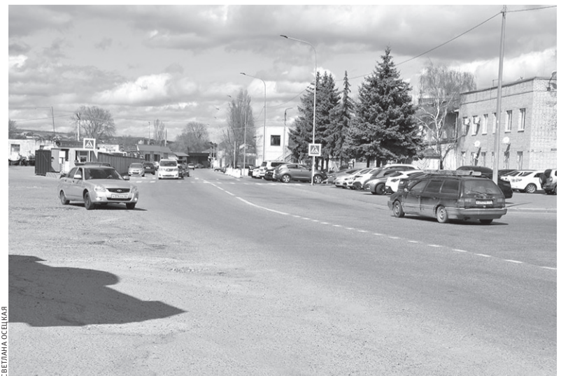
Вид улицы от пересечения с проспектом Ленина

Еще больше интересного и нового на сайте denresp.ru