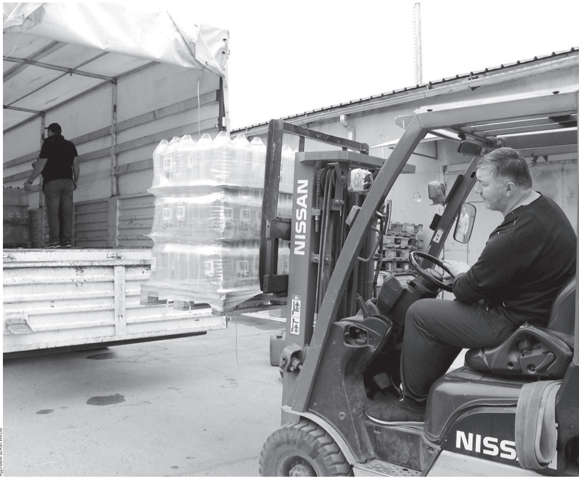
Идет погрузка гуманитарного груза

— Сегодня отдельные населенные пункты Белгородской области подвергаются обстрелу со стороны сил ВСУ. В Белгородской области организуются пункты временного проживания, для того чтобы жители могли переждать это тяжелое время. К нам по партийной линии обратились в рамках проекта «Женское движение Единой России» с просьбой оказать гуманитарную помощь мирным жителям. По поручению Главы